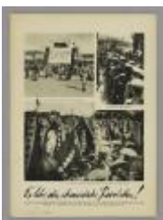
China im Aufstand