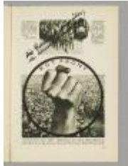
13 Jahre Mord Profit heißt Krieg!