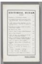
La crisis económica y el ascenso revolucionario [Die Weltwirtschaftskrise und der revolutionäre Aufstieg]