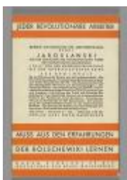
Im revolutionären Aufstieg die Wendung zu den Massen