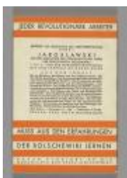
Im revolutionären Aufstieg die Wendung zu den Massen