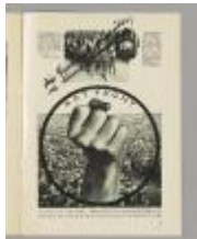
13 Jahre Mord Profit heißt Krieg!