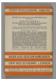
Die Weltwirtschaftskrise und der revolutionäre Aufstieg