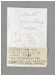
Der Hauptmann von Köpenick