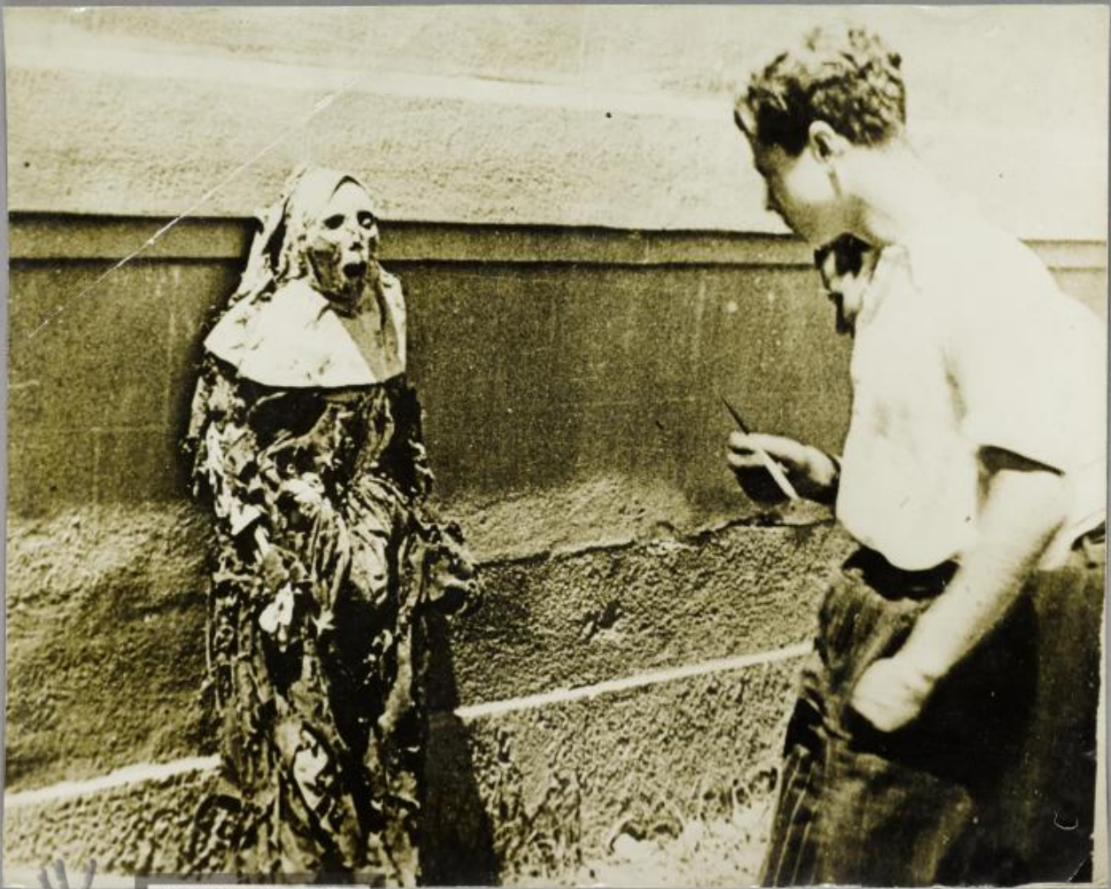
AKADEMIE DER KÜNSTE