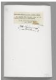
Here and There in the Soviet Union