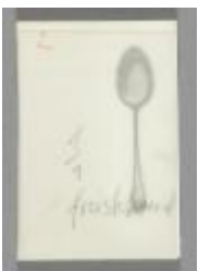
ohne Titel [Löffel]