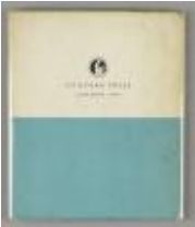
Some Queer Animals and Why