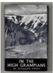
In the High Grampians