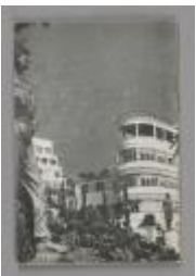
Public Health in the U.S.S.R