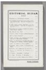
La crisis económica y el ascenso revolucionario