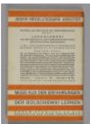
Die Weltwirtschaftskrise und der revolutionäre Aufstieg