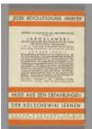
Im revolutionären Aufstieg die Wendung zu den Massen