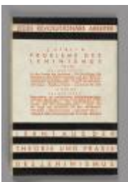
Zu den Fragen der Agrarpolitik der Sowjetunion