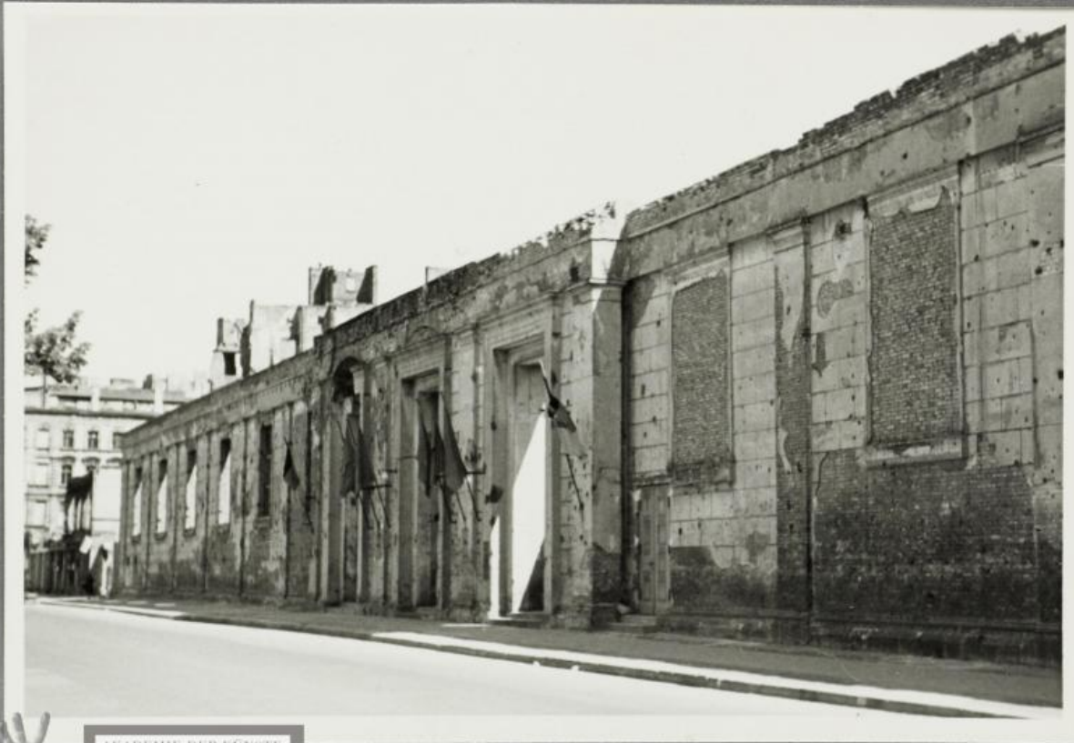
AKADEMIE DER KÜNSTE